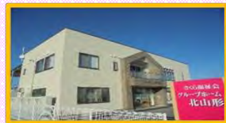
グループホーム北山形

〒997-1311 三川町大字青山字箴元22-1 TEL : 0235-68-1088 FAX : 0235-68-1081