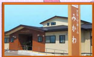
グループホームみかわ

〒999-3511 河北町谷地字砂田207-1 TEL : 0237-71-1201 FAX : 0237-71-1202