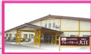
グループホーム大江

〒998-0842 酒田市亀ヶ崎4丁目1-14 TEL : 0234-21-0880 FAX : 0234-21-2306