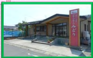
グループホームみどり

〒999-6702 酒田市砂越緑町5丁目43番地 TEL : 0234-61-7551 FAX : 0234-61-7561