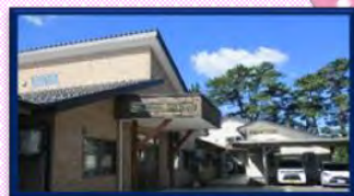
グループホーム亀ヶ崎

〒995-0208 村山市大字富並1469-9 TEL : 0237-52-7033 FAX : 0237-57-2155