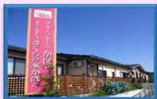
グループホームかほく

〒999-6702 酒田市砂越緑町5丁目43番地 TEL : 0234-61-7551 FAX : 0234-61-7561