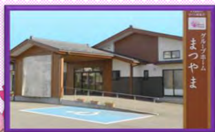
グループホームまつやま

〒990-0885 山形市嶋北3-10-6 TEL : 023-664-0988 FAX : 023-681-2801