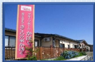
グループホームかほく

〒999-6702 酒田市砂越緑町5丁目43番地 TEL : 0234-61-7551 FAX : 0234-61-7561