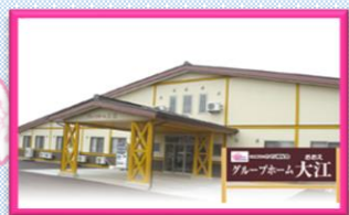
グループホーム大江

〒998-0842 酒田市亀ヶ崎4丁目1-14 TEL : 0234-21-0880 FAX : 0234-21-2306