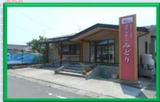
グループホームみどり

〒999-6702 酒田市砂越緑町5丁目43番地 TEL : 0234-61-7551 FAX : 0234-61-7561