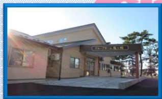
グループホーム亀ヶ崎

〒995-0208 村山市大字富並1469-9 TEL : 0237-52-7033 FAX : 0237-57-2155