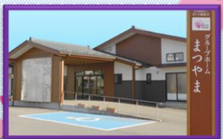
グループホームまつやま

〒990-0885 山形市嶋北三丁目10-6 TEL : 023-664-0788 FAX : 023-681-2801