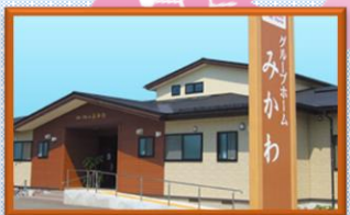
グループホームみかわ

〒999-3511 河北町谷地字砂田207-1 TEL : 0237-71-1201 FAX : 0237-71-1202