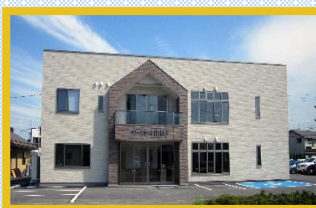
グループホーム北山形

〒997-1311 三川町大字青山字歳元22-1 TEL : 0235-68-1088 FAX : 0235-68-1081