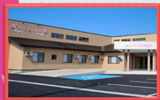
グループホーム村山

〒999-6862 酒田市字西田12-5 TEL : 0234-61-4088 FAX : 0234-61-4087